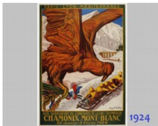
Bild Plakat der ersten Winterolympiade der Olympiaden

Die Información-Cosmos (Amerika) Auswahl Club-InfoK Eurasien – also Europa und Asien Ausgabe Drei zum Bereich Reisen, Sportreisen, Kosmos und WISSENSCHAFT ist hier schon wieder zu Ende. Freue dich auf die kommenden Ausgaben !