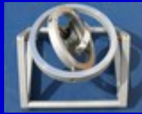
Bild: Giroscopio = Kreisel K