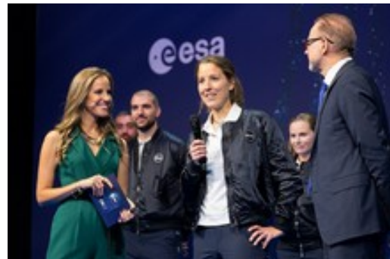
Bild Sophie Adenot im Jahr 2022