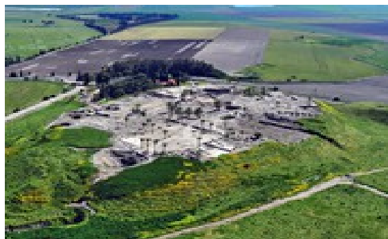
Bild: Megiddo

Die Megiddo Gedenkstätte fällt noch heute deutlich im Raum dort auf, sicherlich kein normaler Urlaubsort. Die Rubrik Studienreisen ist hier wohl die passende Reisebeschreibung?