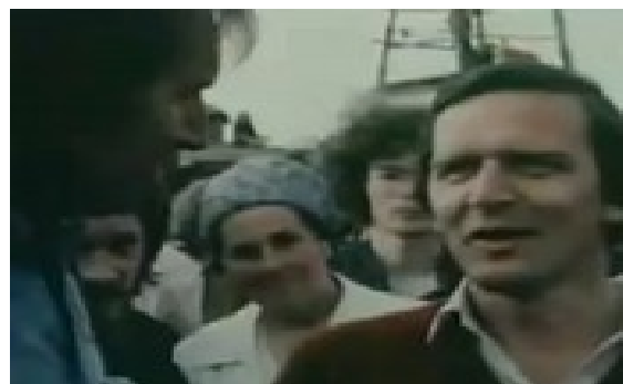
Beim Bürger in Alt-BRD Zeiten Bildbeispiel

Club-InfoK 1986-2001 - Die Raumstation MIR (Russisch: Мир, übersetzt nach DT wörtlich 'Frieden' oder 'Welt'), war die erste Modulare Raumstation und Urvater der ISS-Spacestation, bei der es heute gleich mehrere MIR-Module mit anderem Namen im Orbit gibt. Das ganze MIR-Thema ist wieder ein mögliches Entdeckerthema, das hier erwähnt wird, da Russland und Indien nun ab wohl 2027-2028 planen auf der Route der ISS-Spacestation eigene Raumstationen zu errichten. Die Russische Föderation plant dazu nach Angabe die Abkopplung von ISS-Spacestation Modul-Einheiten in MIR Größe und eine Ankopplung an neue ROS-Module. Indien (Asien) plant eine eigene neue Raumstation im Abstand dazu.