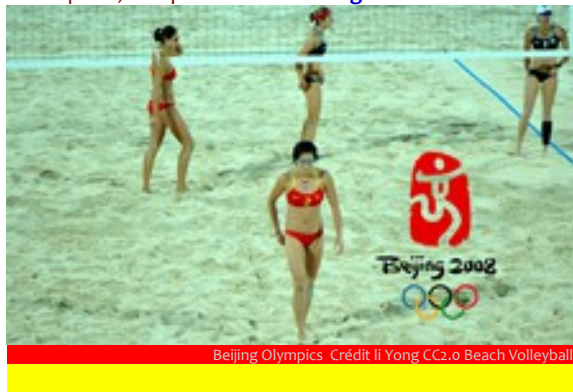
Beijing Olympics Beach Volleyball

Meldung 01-2026: Cricket, Baseball, Flag Football, Lacrosse und Squash, als Sportarten in Los Angeles Kalifornien dabei.