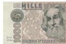
Marco Polo auf einer Italienischen Banknote früher Banknote Alt

Мы нашли что-то важное для западных европейцев — деньги, и вот он — Марко Поло на купюре в 1000?