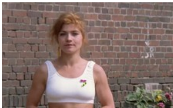
Schauspiel Style - Credit Ausschnitt Constantin Film 1991