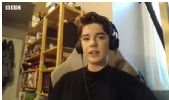
Ausschnitt BBC UK im Jahr der Verbote Ideen 2020 zu Thema TIKTOK

MTV Musik-TV August 1981 Kabelnetz Amerika – Dezember 2025 ?