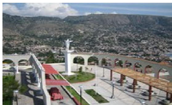
Bild Zweiter Austragungsort Bolivarianen Games – Symbolbild Ayacucho (Peru) Credit Fer121 CC3.0 2009

Die Bolivarianen Games wurden mit Olympia Flagge (Griechenland Herkunft) und Eröffnungsfeier inszeniert und auf vielen Kanälen bis ins Internet übertragen.