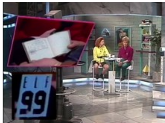
Bild TV-Format ELF99 von DFF-TV Zentraldeutschland 1989 auf den MTV Sendestart aus Amsterdam (Europa) in 1987 Copyright Hyperlink auf Bild ist Song Nummer Eins von MTV-Amerika, das vielleicht schon damals im Kabelnetz (TV-Networks) bis Feuerland auch in Südamerika sendete.

Anmerkung: Deutschland sieht sich selbst als wichtigster Handelspartner innerhalb EU.