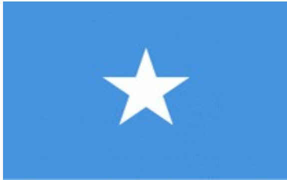
Es folgt Club-InfoK Plus Material: