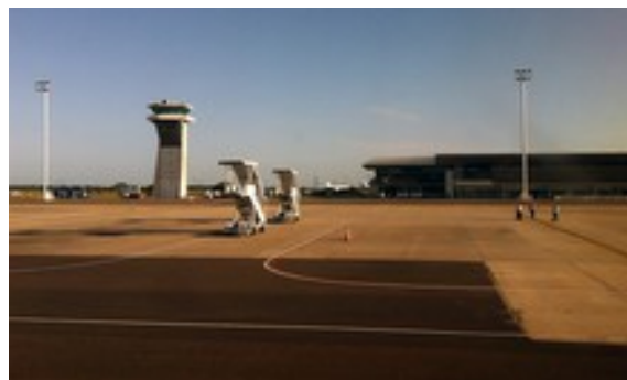
Flughafenblick Punta de Este – es ist auch ein Marine Airport von Uruguay Rollbahn 2013

Fussball URU heute: Das Fußballteam Uruguays macht auch Freundschaftsspiele, zum Beispiel mit Österreich, heute konzentriert man sich aber wohl im Fussball auf Fussball WM's, auch mit Erfolgen.