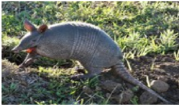
Gürteltier – wie in Uruguay heimisch