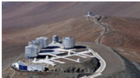
Bild Ausschnitt ESO Sternwarten-Anlage

Ein relativ unbekannte Song von der Hoffnung als Hyperlink auf dem Bild: Hoffnung (Song) 2024 im Laden