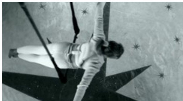
Bild Crédit Ausschnitt Videomusik-Video Das Beste (Song) von Band Silbermond Homepage

Chancen für viele weitere Information in einer Zukunft – aus Südamerika hier