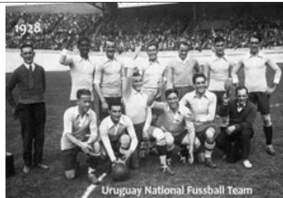
Bild Olympiateam 1928 – Das Nationale Fußballteam von Uruguay war ein Gewinner – zum Zweiten mal Credit Public