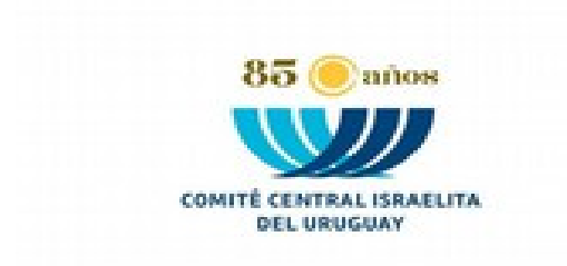
Das Zentralkomitee in Uruguay feiert im Dezember 2025 schon 85 Jahre – 1940 - 2025