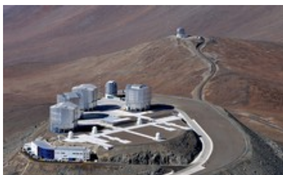
Bild Ausschnitt einer Anlage - die in den 60ern entschieden wurde

CEAM | Deutsche Evangelische Gemeinde von Montevideo Uruguay