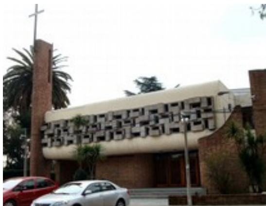
Bild Credit Hoverfish CC3.0 2010 Luis Alberto de Herrera Avenue - Montevideo Uruguay

Bild EV Besonderheit Evangelische Armenische Kirche, aber auch Mischungen mit Calvinismus und Evangelischen Richtungen und Entwicklungen aus Amerika (USA) gibt es.